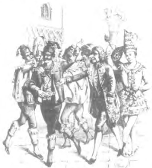
Carnevale a Venezia

vestito è fatto con tanti piccoli pezzi colorati ed è diventato il simbolo della festa e della allegria. Al sud invece, il vestito bianco di Pulcinella è certamente il più popolare.